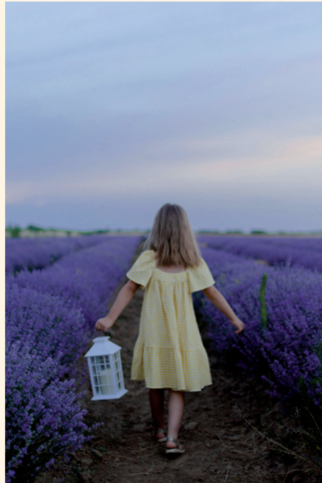
Foto kافت: Mariabeeld, priorij De Essenburgh, Hierden. Foto pagina 2: Bloemenpracht. Boven: jeugdig vakantiegenot in geurende lavendelvelden.

Kortom: genoeg voor een aantal lange, mooie zomeravonden. We wensen u veel leesvreugde en een mooie zomer. ♦